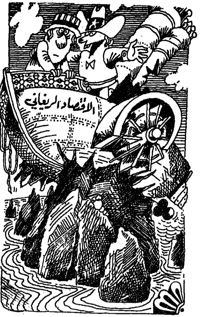
الادمان واسعة ولو في الجياه الفلحة